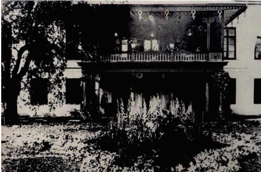
Tagafassaad 19. sajandi lõpust pärineva puitrõduga enne 1939. aastat.

Tollal oli niisugune puitpitsi ja värviliste klaasakendega kaunistatud ehitis suurmoeks. Selle rajamisel ei arvestatud tihti kõige elementaarsematki stiilide kokkusobivust ja proportsioone. Nii mõjus ka Roosna-Alliku mõisa pargipoolse fassaadi sekundaarne rõdu võõrkehana. Esialgne rõdu võis sarnaneda esifassaadi omaga. Kindlasti pidi see aga olema olema, sest pikk seinafont nõudis liigendust keskteljel, tasakaalustamaks külgrisaliite.